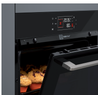
Hot Air Shield